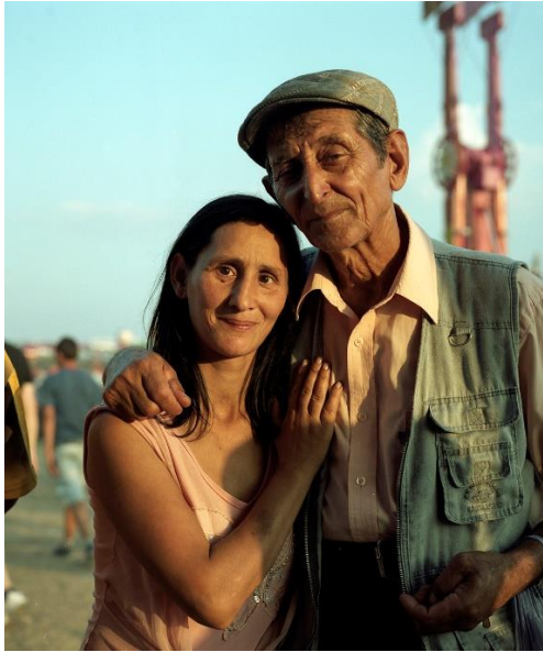
Tata si fiica, Vaslui